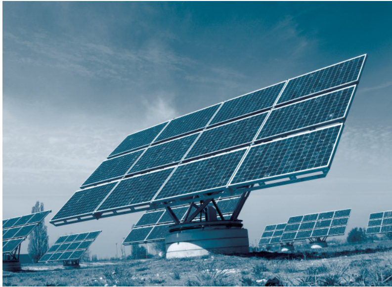
SOLON-Mover in Berlin Adlershof